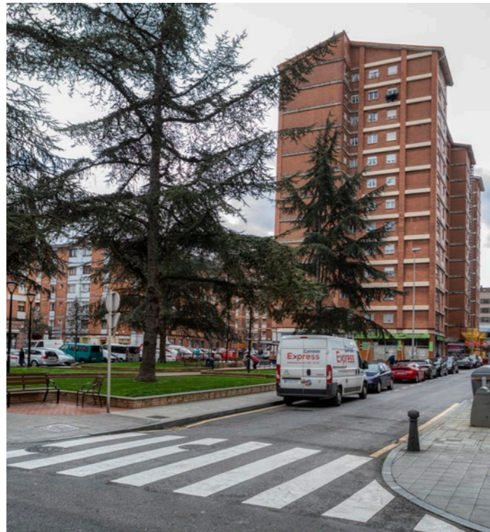
El parque de La Algodonera, en un extremo de los terrenos que ocupó la fábrica