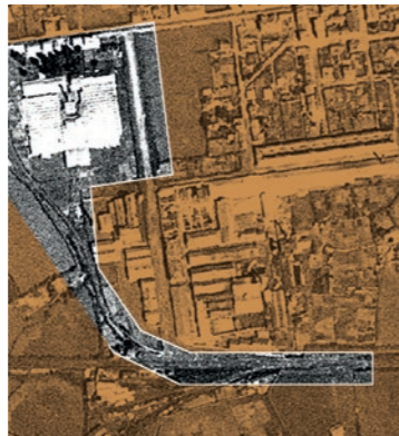
Espacio ocupado por la fábrica en 1956

Gracias a la publicidad y la calidad de sus productos se convirtió en un referente en la elaboración de textiles de algodón. Como decía una de sus cuñas publicitarias: «las sábanas de La Algodonera, duran la vida entera». Pero La Algodonera de Gijón no pudo resistir la transformación económica que sufrió el país en los años 60 del siglo XX. Y en ese momento de gran transformación socioeconómica y cambio de modelo productivo, cesa su actividad en 1967.