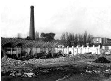
Demolición de la fábrica en 1969